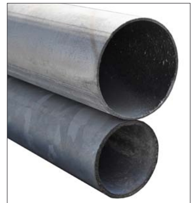
Rohrpfosten aus verzinktem Stahl Ø 76 und 60 mm

Rohrschellen aus verzinktem Stahl oder Aluminium Schellen mit Durchmesser 60 oder 76 mm, zur Aufnahme von Flachschilder. Einseitige oder doppelseitige Schildaufnahme. Langschellen bis 900 mm Lochabstand.