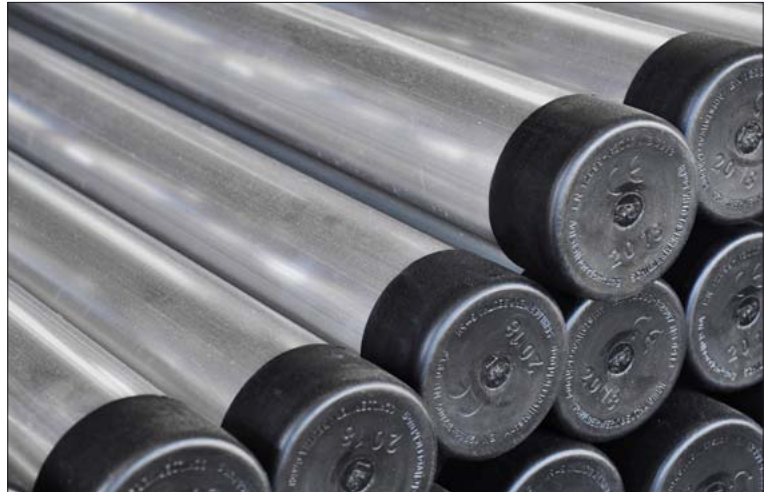
Rohrpfosten aus Aluminium Ø 60 mm mit Abschlusskappe

Rohrpfosten aus verzinktem Stahl oder Aluminium Rohrpfosten Durchmesser 60 oder 76 mm, inkl. Erdanker und Abdeckkappe aus Kunststoff schwarz. Verschiedene Wandstärken für jeden Einsatzzweck.