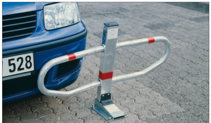
FLEXY Parkbügel - Neigung bis 45° ohne Beschädigung