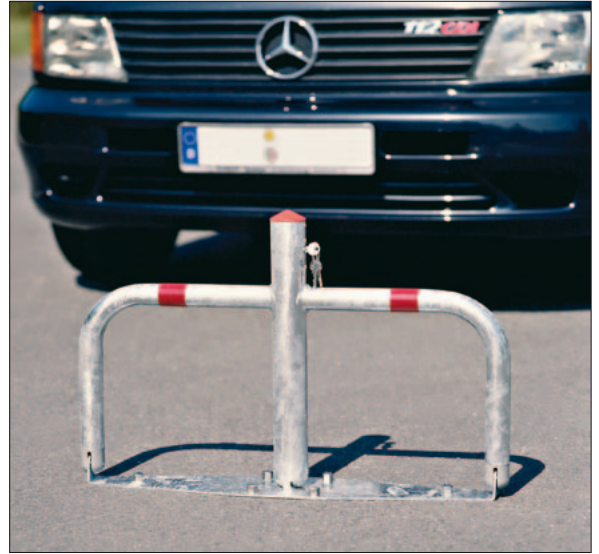
Parkbügel mit Bodenplatte zum Aufdübeln