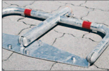
Parkbügel in Überfahrstellung