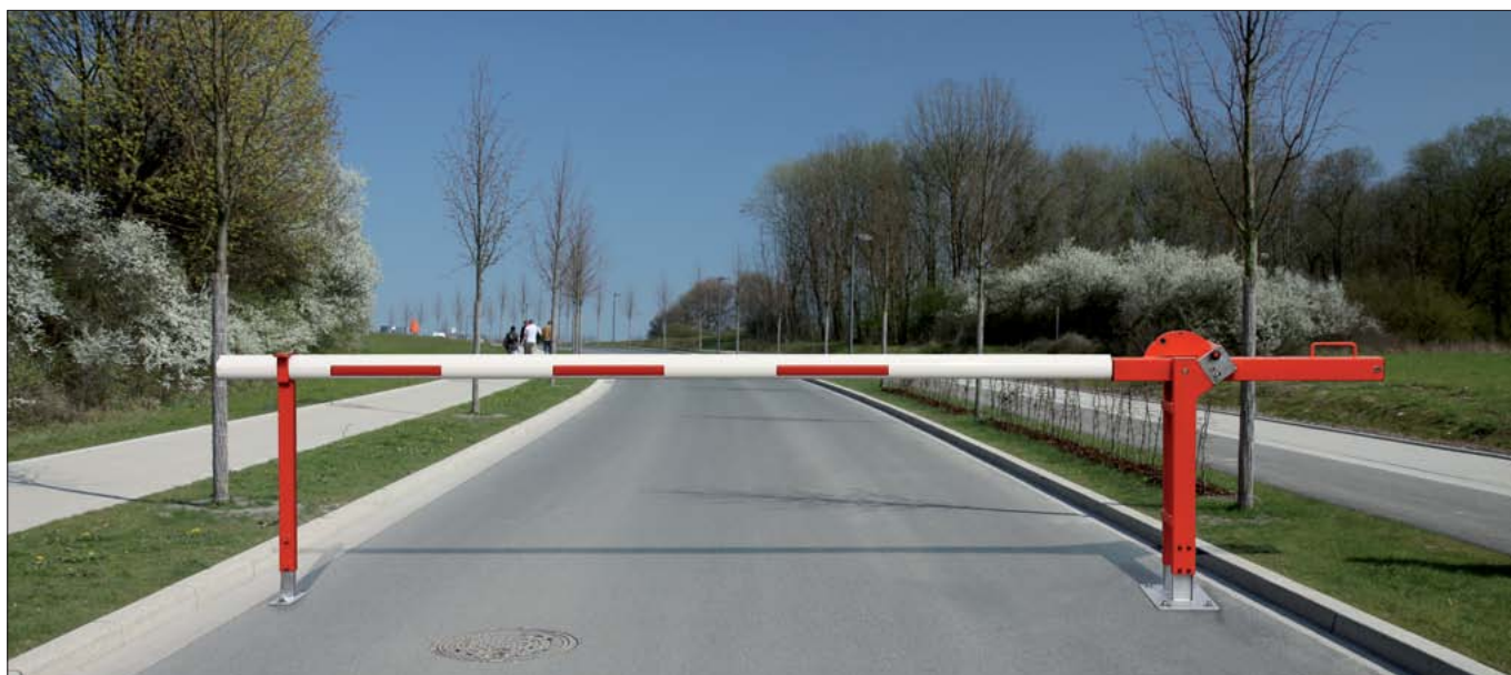
Wegesperre mit Gegengewicht, Ausführung mit Bodenplatten zum Aufdübeln, rot/weiß