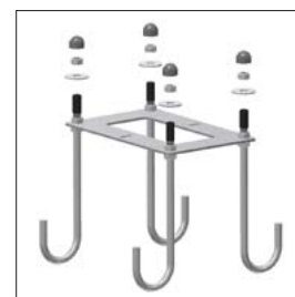
Ankerkorb zum Einbetonieren zur Aufnahme der Bodenplatte Best.-Nr. 470 875 MA Euro 82,00