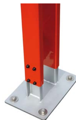
Bodenplatte zum Aufdübeln höhenverstellbar für eine einfache Montage