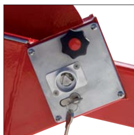
Doppelschließung Dreikant- und Profilhalbzylinder Best.-Nr. 470 972 MA Euro 117,00

Pendelstütze gefedert und höhenverstellbar statt Auflagstütze