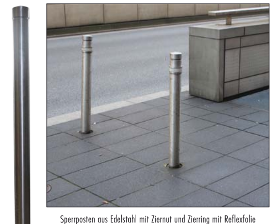
Sperrpfosten aus Edelstahl mit Ziernut und Zierring mit Reflexfolie