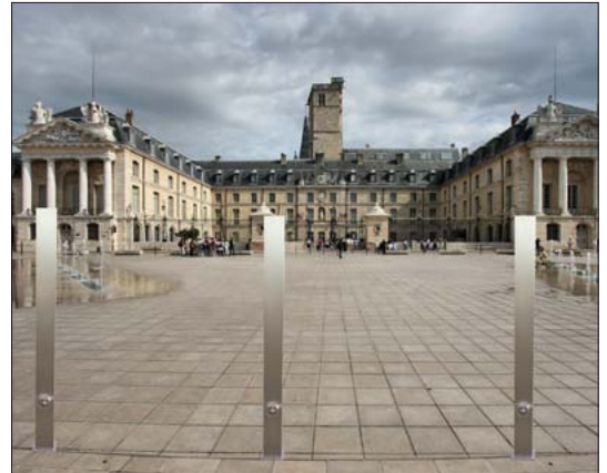
Sperrpfosten aus Edelstahl 70 x 70 mm herausnehmbar mit Dreikant