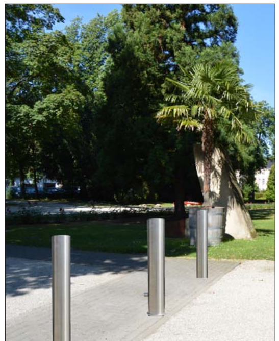
Sperrpfosten aus Edelstahl Ø 154 mm