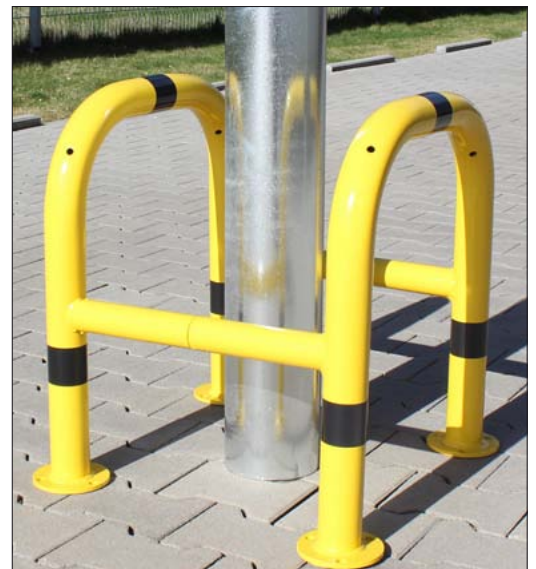
Pfostenschutz zum Aufdübeln