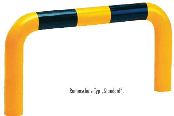
Rammschutz Typ „Standard“,

Weitere Abmessungen und Durchmesser liefern wir auf Anfrage.