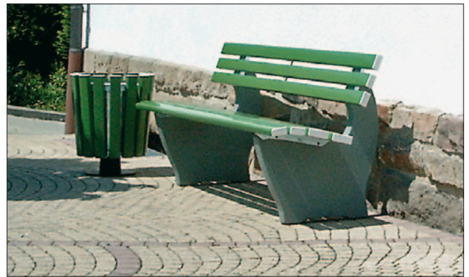
Sitzbank mit Untergestell Modell 2 (M2) zum freien Aufstellen