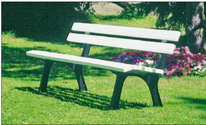
Sitzbank mit Gussuntergestell und Recycling-Bohlen in weiß

Kunststoff gewinnt immer mehr an Bedeutung, denn sie sind sozusagen „wartungsfrei“. Durch eine umfangreiche Farbauswahl passen sich die Bänke hervorragend ihrer Umgebung an. Für den ländlichen Bereich wählen Sie zwischen der Holzart Nordische Fichte (kesseldruckimprägniert) und Kambala. Alle Auflagenvarianten lassen sich auch mit einem massiven, gusseisernen Untergestell in schwarz beschichtet kombinieren. Die Rückenlehne wird mit 3 Bohlen (außer bei Kunststoff-Recycling mit 2 Bohlen) und die Sitzfläche mit 4 Bohlen ausgestattet. Bei Bestellung bitte Farbe für Kunststoff-Bohlen mit angeben! Für PVC-Bohlen: hell-elfenbein, rot, braun und grün. Für Kunststoff-Recycling-Bohlen: braun, grün und weiß.