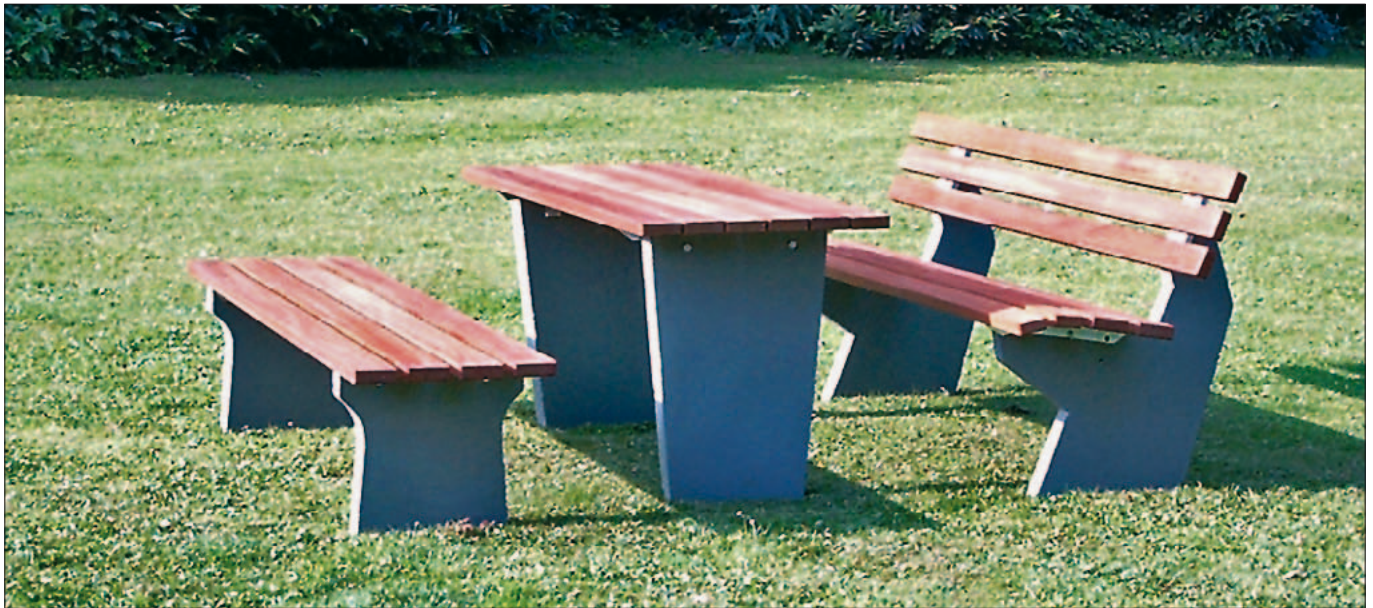
Kombination: Tisch mit Hocker- und Parkbank, Ausführung Betonsockel M1 zum Eingraben, Auflagen in der Holzart Kambala, Oberfläche lasiert

Parkbänke für den robusten Einsatzzweck. Die Betonfüße zum Eingraben oder zum freien Aufstellen (M2) sorgen auch bei schwierigem Gelände für einen sicheren Stand. Für die Sitzbänke stehen zwei Modellformen (M1 und M2) zur Auswahl, welche mit verschiedenen Kunststoff- und Holzbohlen variiert werden können.