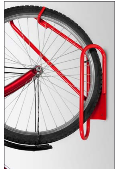
Fahrrad-Hängeparker 90° in RAL 3020