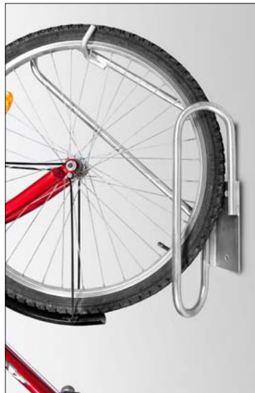
Fahrrad-Hängeparker 90° verzinkt