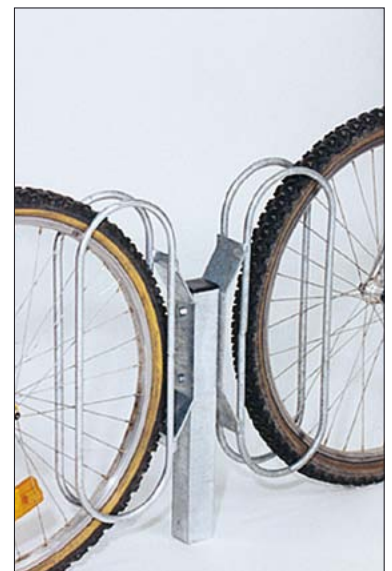
2 Stück Fahrrad-Wandparker starr mit Stützfuß