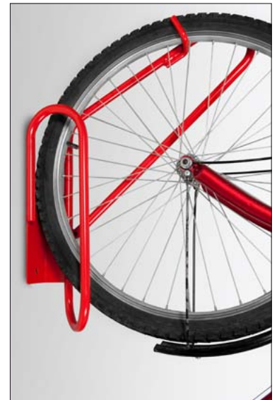
Fahrrad-Hängeparker 90° in RAL 3020