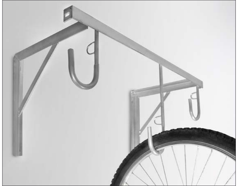
Fahrrad-Reihen-Hängeparker zur Wandbefestigung