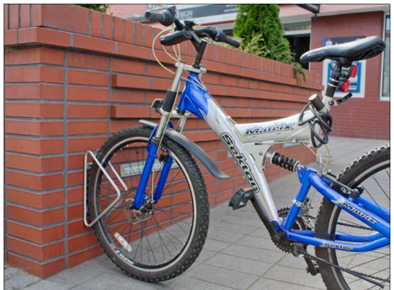
Einzelwandparker „DREIECK“ 90°