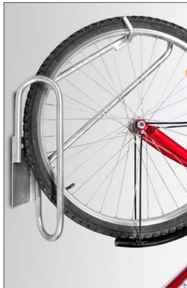
Fahrrad-Hängeparker 90° verzinkt