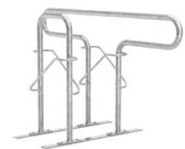
Fahrrad-Anlehnbügel Reihenparker Typ „LINE“