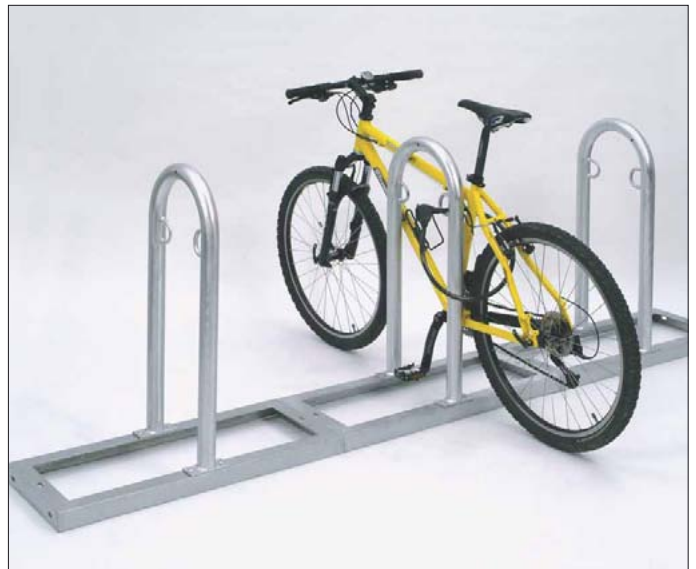
Fahrrad-Anlehnbügel mit Bodenrahmen Typ „SERIES“ mit 3 Bügeln