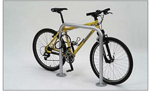
Fahrrad-Anlehnbügel Typ „SOLUTION“, mit Bodenplatten zum Aufdübeln