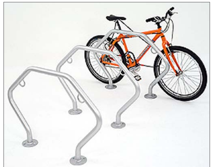
Fahrrad-Anlehnbügel „SECHSECK“ mit Bodenplatten zum Aufdübeln