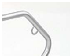
Angeschweißte Öse zur Positionierung des Fahrradschlusses