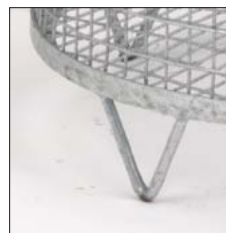
Standfuß aus Rundstahl