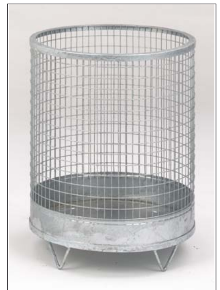
Drahtgitter Abfallkorb „Rund“ mit Stahlblechboden