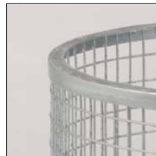
Oberring aus Winkelstahl