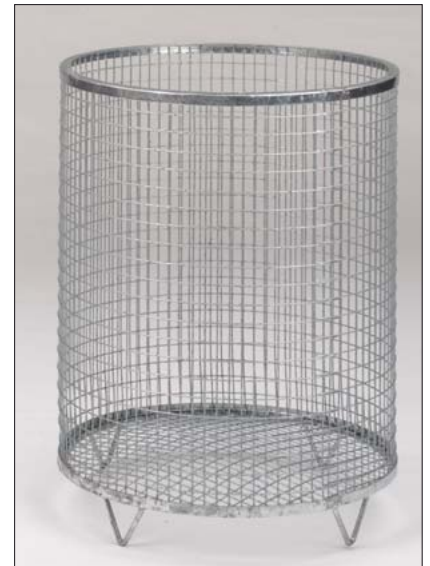
Drahtgitter Abfallkorb „Rund“ mit Gitterboden