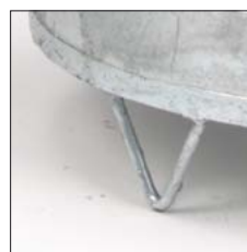
Blechsockel mit Standfuß