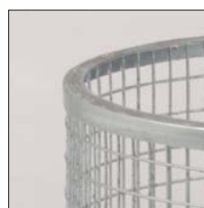
Oberring aus Winkelstahl