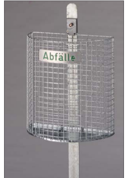
Abfallkorb „Halbkreis“ 27 Liter mit Eisenständer