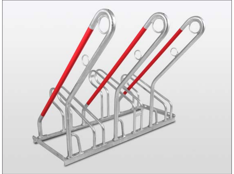
Bügelparker „Der Klassiker“ mit schmalen Anlehnbügel