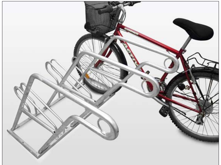
Bügelparker „Der Klassiker“ mit breitem Anlehnbügel