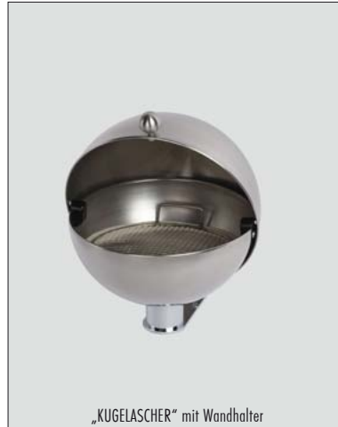
„KUGELASCHER“ mit Wandhalter