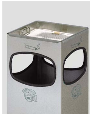
Standascher-/Abfallkombination „STANDBOY“ mit 4 großen Einwurfföffnungen