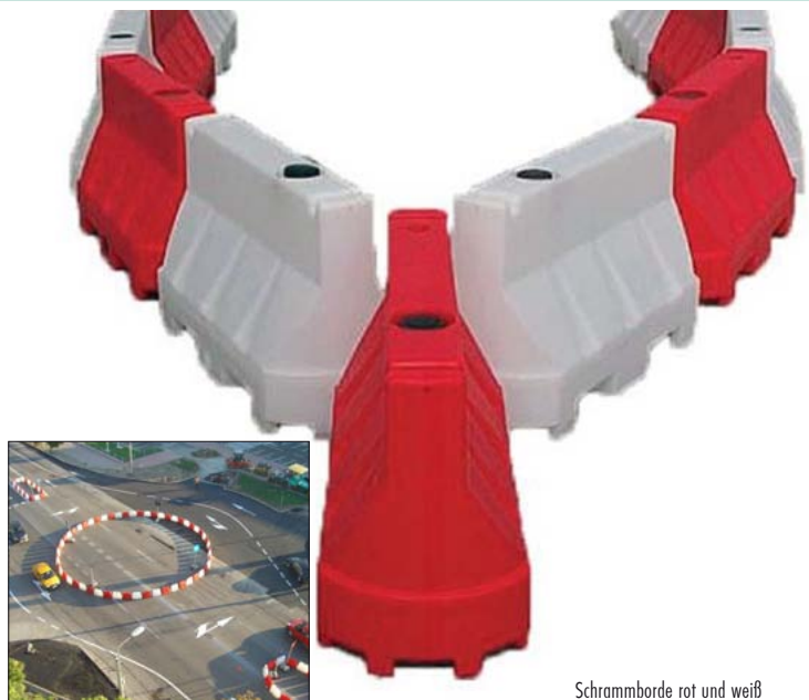
Schrammborde rot und weiß