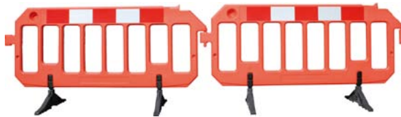
Absperrschranke in Reihe verkettbar und Füße verstellbar

*Hinweis: Anbruch einer Verpackungseinheit liefern wir auf Anfrage.