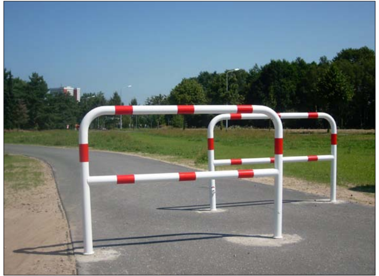
Absperrbügel rot/weiß mit Mittelstrebe